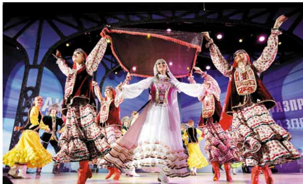
Ансамбль танца «Агидель», танец «Башкирская свадьба». ОАО «Газпром нефтехим Салават»