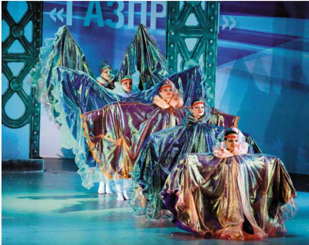
Вокальная группа «Сияние Севера»

(ООО «Газпром трансгаз Томск»): – «Факел» – это праздник! Впечатлений масса, ведь за время фестиваля мы успеваем почувствовать себя и участниками, и зрителями. Когда готовишься к выступлению, то очень волнуешься, переживаешь, думаешь: «Как все пройдет, как примет жюри?». А когда сидишь в зале, то ты просто наслаждаешься тем, что происходит вокруг, и ощущаешь настоящий фейерверк радости.