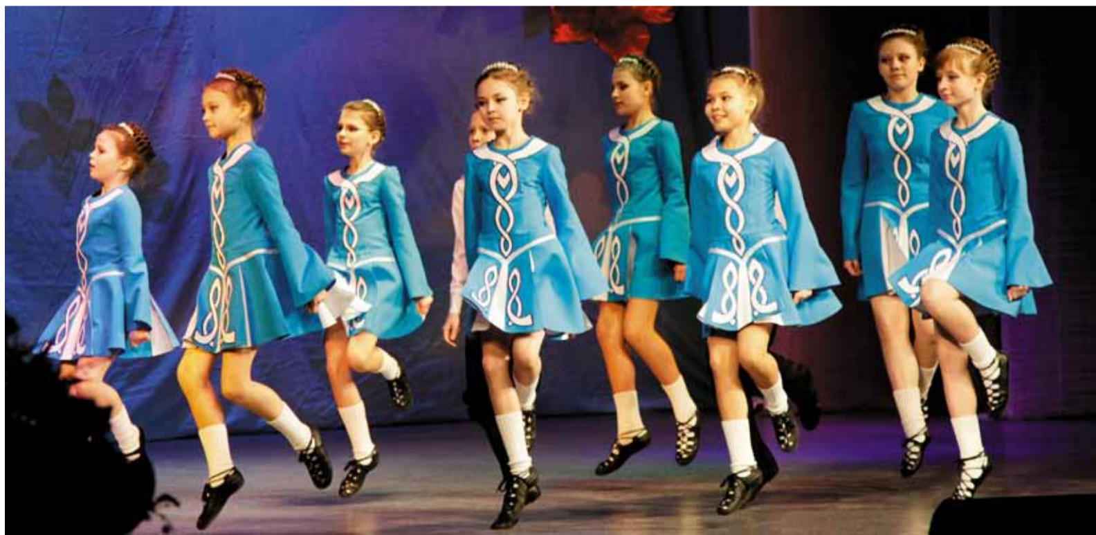
Танцевальная студия «Эрика»