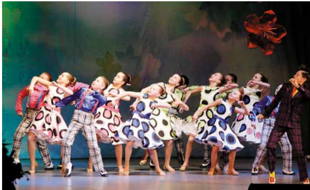
Энергия танца – энергии жизни

Фонд – это социальная структура. Он создан по собственной инициативе человека, который однажды оказался один на один с бедой. Тогда не нашелся тот, кто бы протянул семье руку помощи. Благотворительный кон-