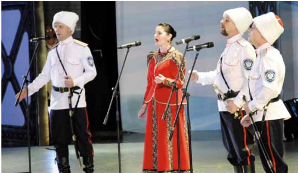
Вокальный ансамбль «Альянс»