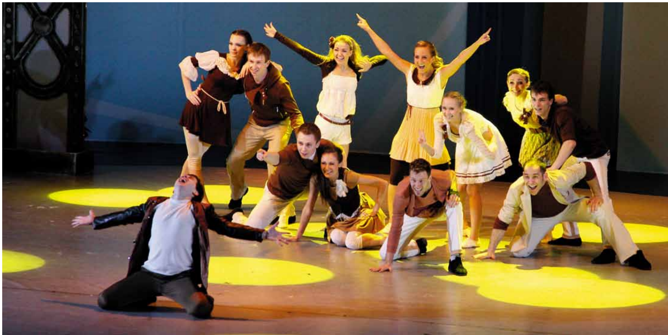
Театр танца «Вертикаль», танец «Это всё». ООО «Газпром трансгаз Чайковский»