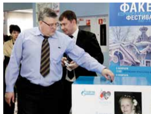
На концерте собрано более 280 тысяч рублей