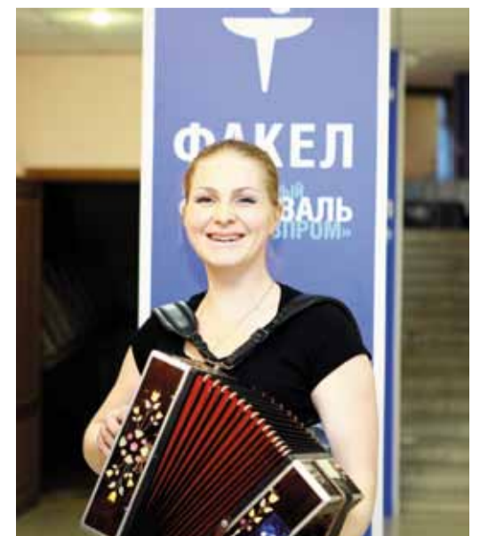
Я спую вам и сыграю